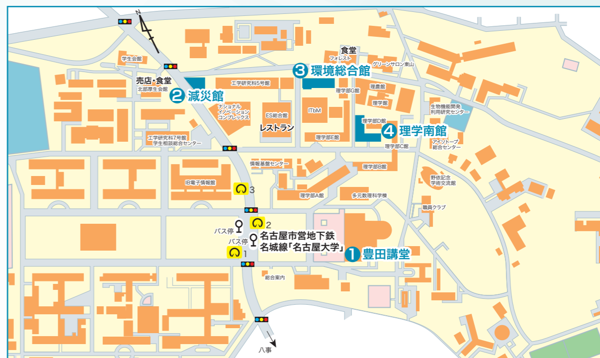
○名古屋市営地下鉄 名城線「名古屋大学」駅下車 2番出口から徒歩約5~10分 ※会場には駐車場がありませんので公共交通機関でお越しください

① 豊田講堂 ホール・シンポジオン ② 減災館 ③ 環境総合館 レクチャーホール ④ 理学南館 坂田・平田ホール