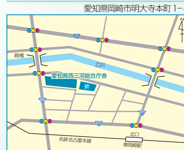
○名鉄名古屋本線「東岡崎」駅下車 北口から徒歩約5分