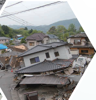
▲熊本地震(2016年)