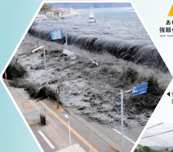
▲東日本大震災(2011年)