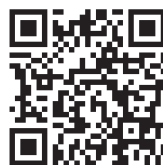
あいち・なごや強靱化共創センター