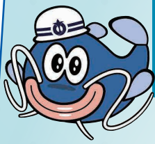
あいち防災キャラクター 防災ナマズン