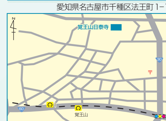
○名古屋市営地下鉄 東山線「覚王山」駅下車 1番出口から徒歩約10分 ※会場には駐車場がありませんので公共交通機関でお越しください