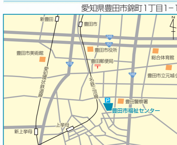
○名鉄三河線「豊田市」駅から徒歩約30分、「上學母」駅から徒歩約10分 ○愛知環状鉄道「新豊田」駅から徒歩約35分、「新上學母」駅から徒歩約15分